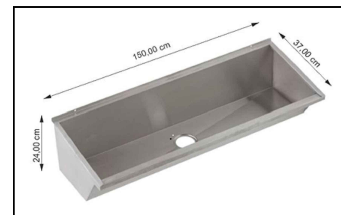
LAVATÓRIO COLETIVO INOX - 1,50 m