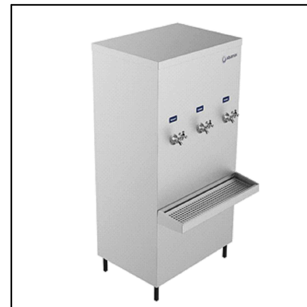
BEBEDOURO INOX INDUSTRIAL - CAP. 100 L